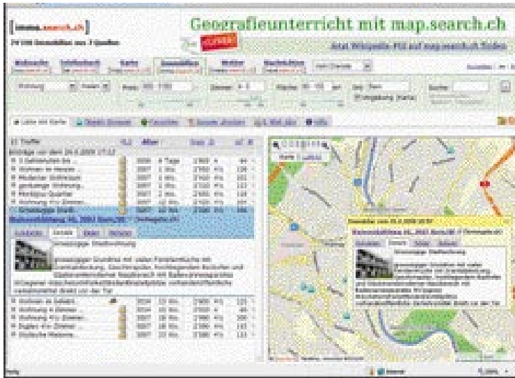
Kartengestützte Suche nach Objekten mit benutzerfreundlicher Suchparametrisierung.

Netmetrix Mai 2009) aufgerufen wird und derzeit über 50 000 Objekte anpreist. Die mittlerweile zum Ringier-Konzern gehörende Scout24-Gruppe betreibt mit Immoscout24 ebenfalls eine erfolgreiche Immobilienplattform in ihrer Vertical-Strategie. Vom Look & Feel her ist diese analog den weiteren Scout-Plattformen wie Jobscout oder Autoscout aufgebaut. Immostreet ist der Dritte im Bunde und ist nach wie vor im Privatbesitz. Vom Umfang her bieten alle drei Anbieter vergleichbare Funktionen, wobei sehr starke Unterschiede im Bereich der Usability feststellbar sind. Zudem gibt es regionale Ausprägungen. Homegate ist auf dem Platz Zürich klar führend. In der Ostschweiz jedoch dürfte Immoscout24 dominanter sein, was nicht zuletzt darauf zurückzuführen ist, dass Immoscout24 aus der Übernahme von «Immo-Online Wil» entstanden ist.